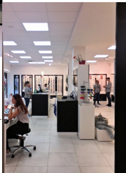
EINGANG ZUM LADENLOKAL .....