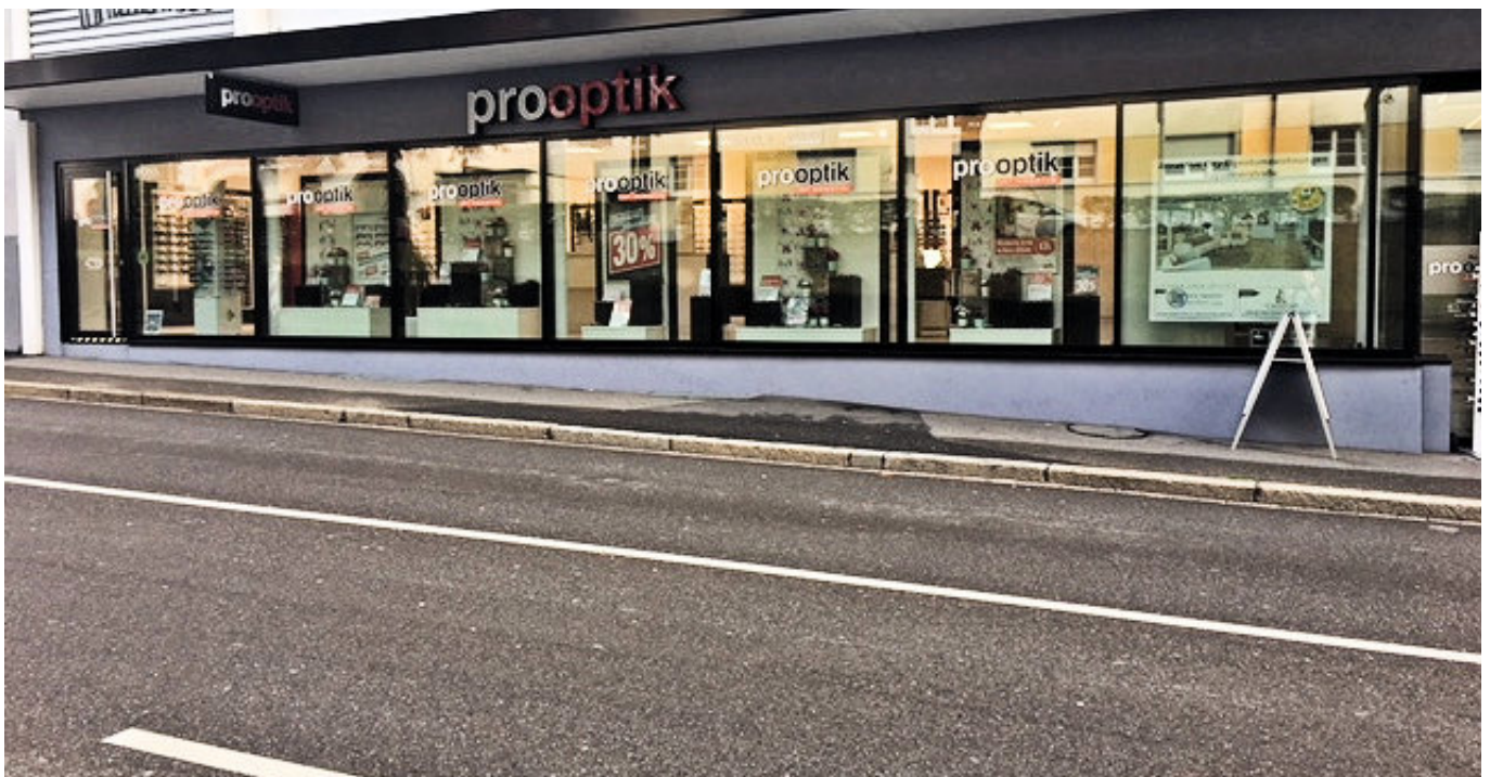
FENSTERFRONT 15 METER .....