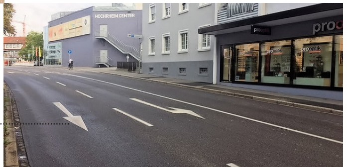
LADENLOKAL ZUM ZENTRUM .....